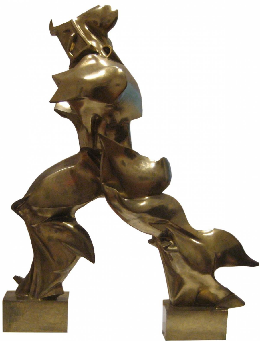
Forme uniche della continuità nello spazio, 1913, Bronzo, 126,4 cm, Museo d'Arte, San Paolo