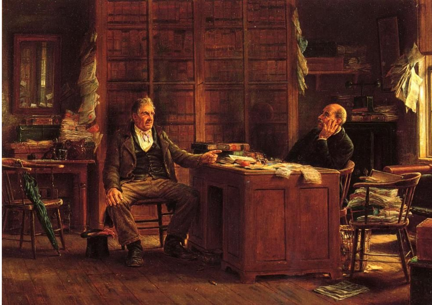
EDWARD LAMSON HENRY, 1895