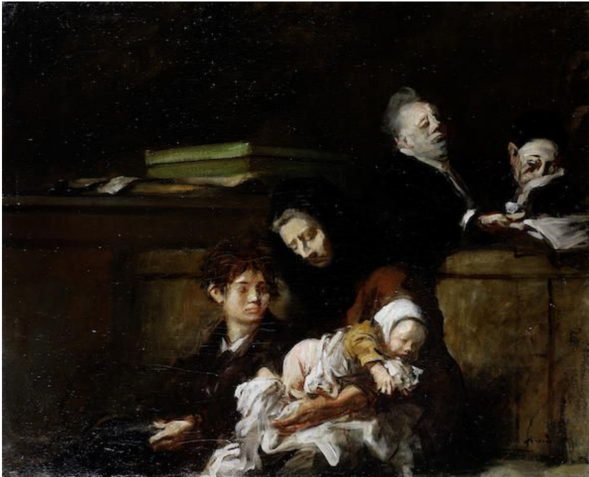
JEAN LOUIS FORAIN (FRENCH, 1852-1931) L'avvocato generale, olio su tela, 1911, Collezione privata