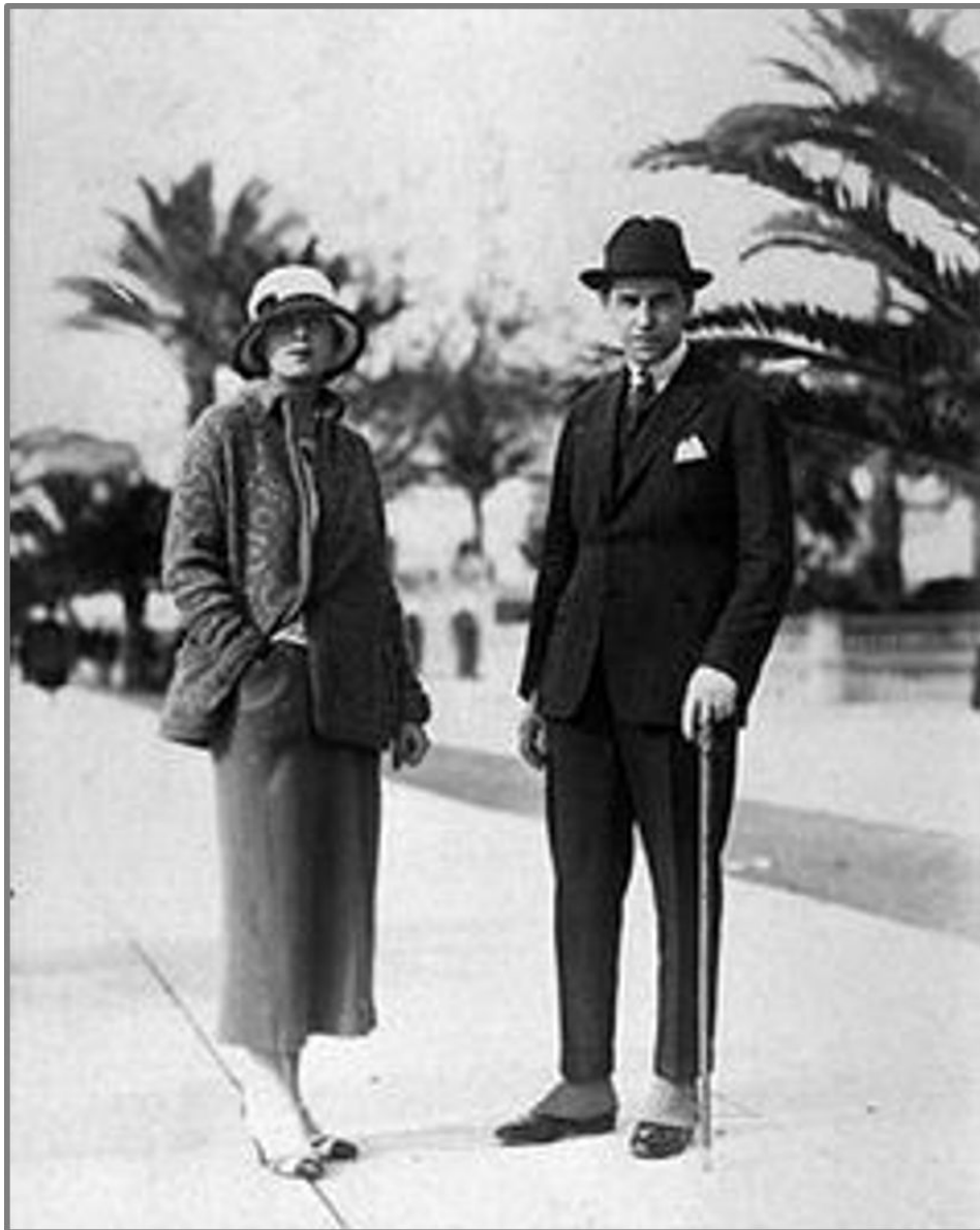
Tamara de Lempicka, e Tadeusz de Lempicki sulla Croisette a Cannes (1928 circa).