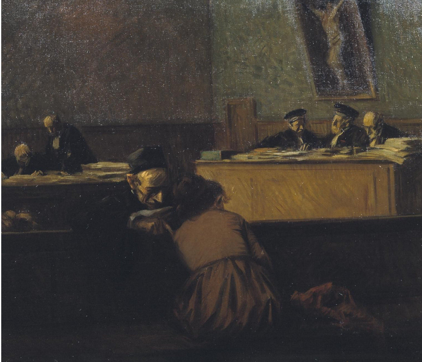
Jean-Louis Forain, Il Tribunale, olio su tela, 1918, Tate Modern, Londra.