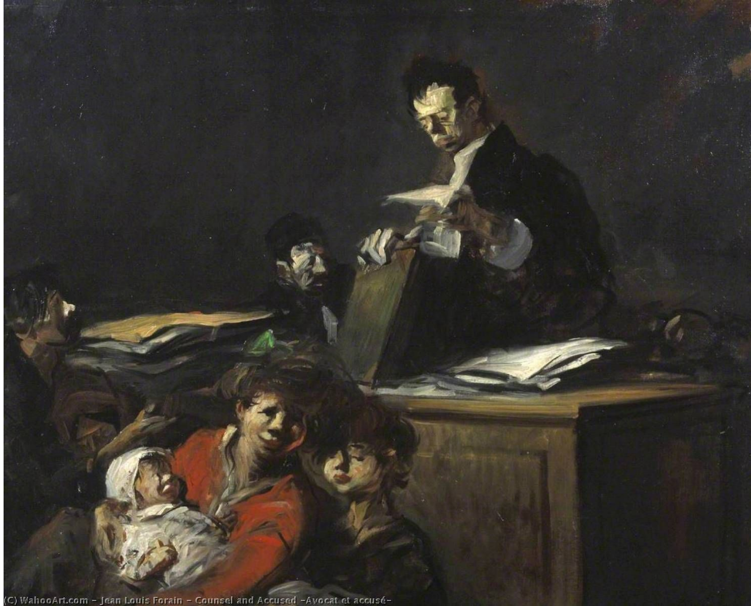
JEAN LOUIS FORAIN, 1908