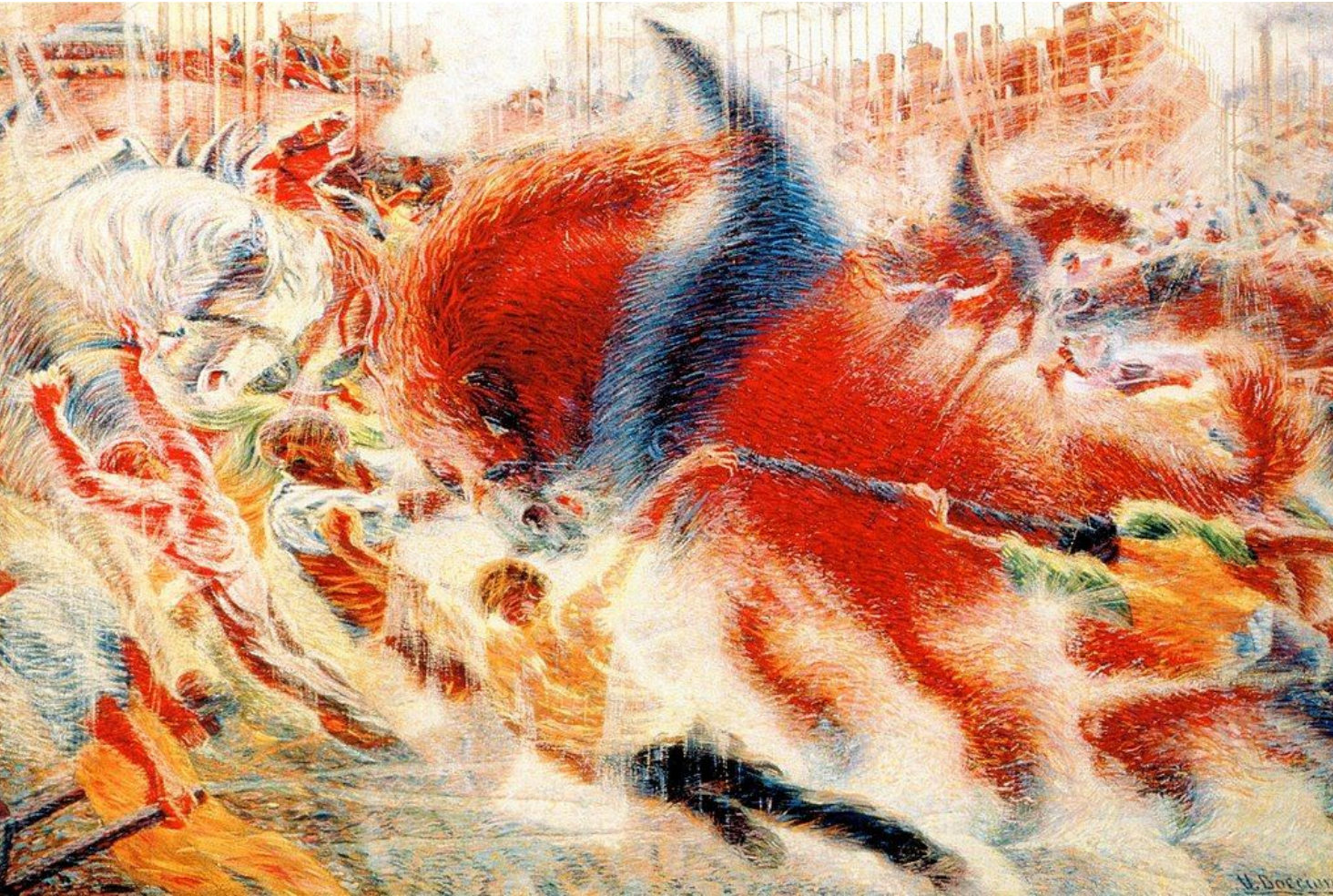
Umberto Boccioni, La città che sale, 1911, olio su tela, Museum of Modern Art, New York