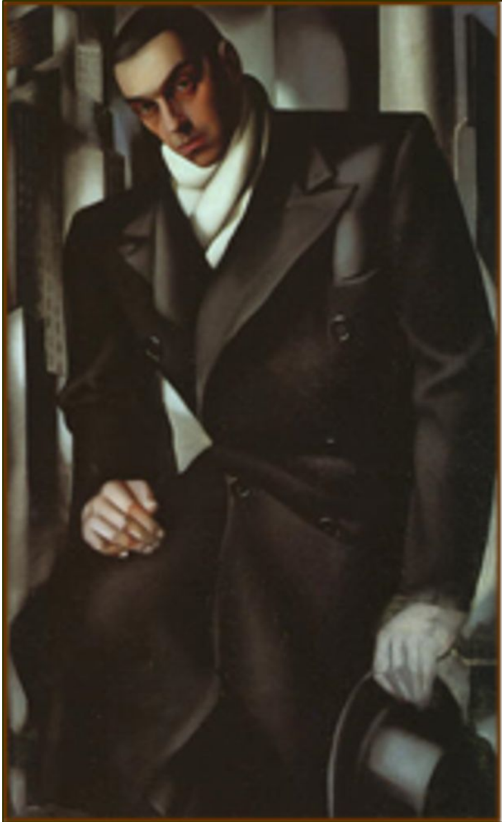
Tamara de Lempicka, Ritratto di Tadeusz de Lempicki (incomputo, 1928); olio su tela, 130 x 81 cm. Parigi, Musée National d'Art Moderne.