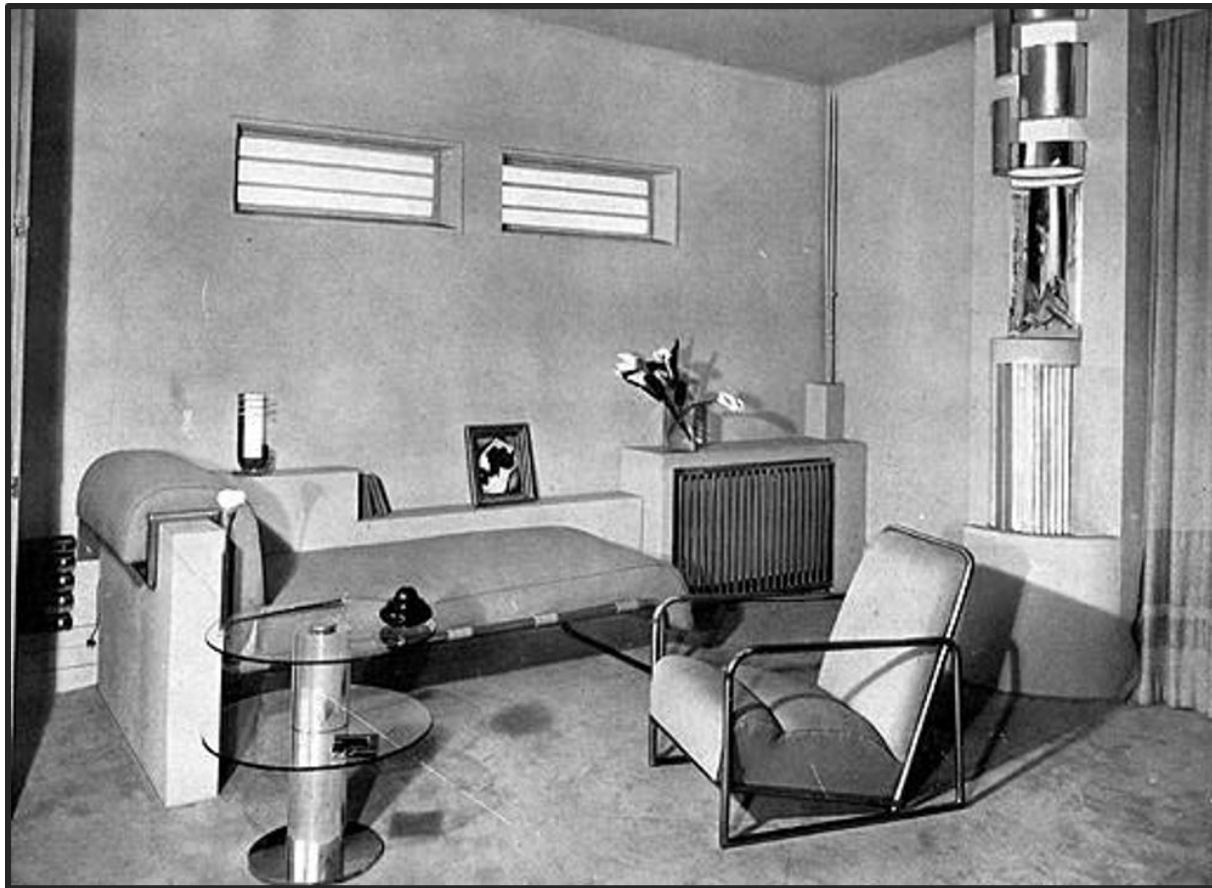
Casa-atelier di Tamara de Lempicka in Rue Méchain, 7, Parigi - angolo salotto sotto le scale (1930 circa).