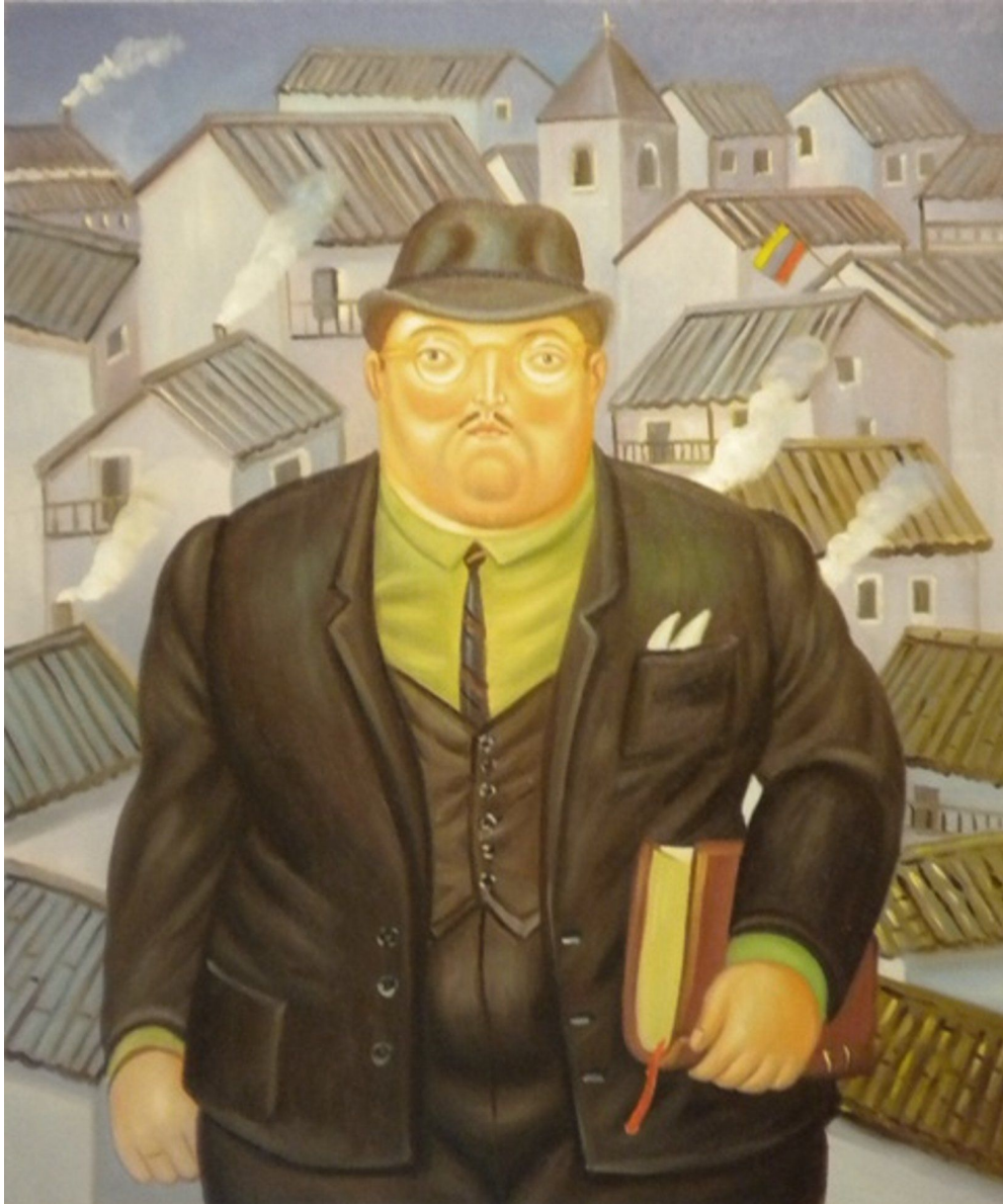
Fernando Botero, L'avvocato, 1978, olio su tela, Museo Botero, Bogotà