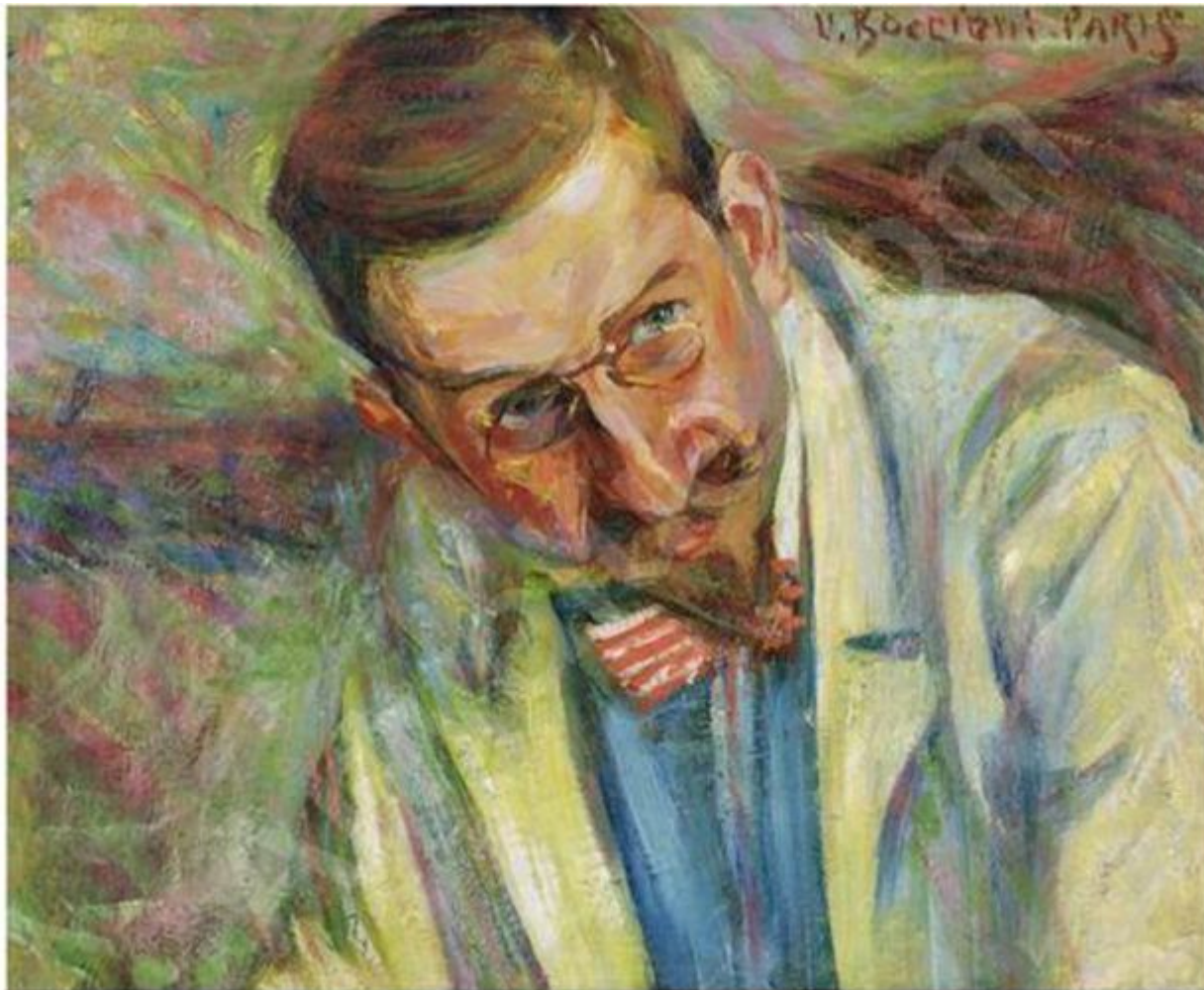
Umberto Boccioni, Ritratto dell'Avvocato Zironda, 1907, Collezione privata